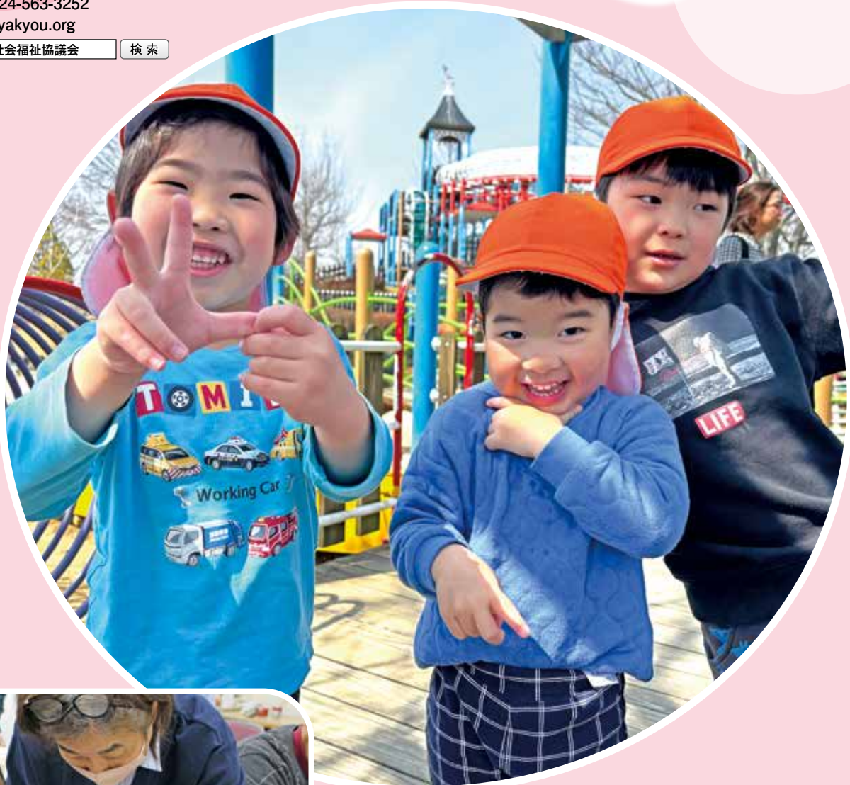
大泉公園で広がる春の笑顔（伊達市ひまわり園）