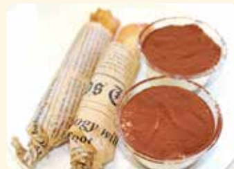
「はるまきアップルパイ」 「簡単ティラミス」