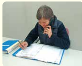
ボランティア あじさい