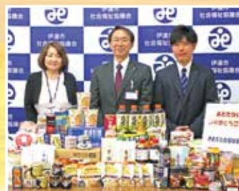
伊達市役所生活環境課 様