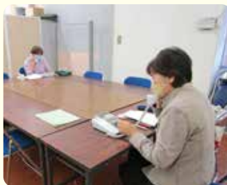
傾聴ボランティア ハートフレンズ