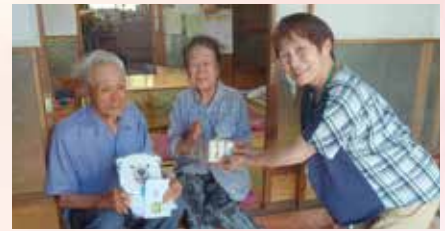
高齢世帯見守り訪問