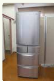
フードバンク食材保管用冷蔵庫

この事業は、皆様から協力いただいた赤い羽根共同募金が財源となっております。ありがとうございました。