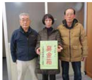
一般寄付 寿クラブチャリティイ カラオケの集い 様