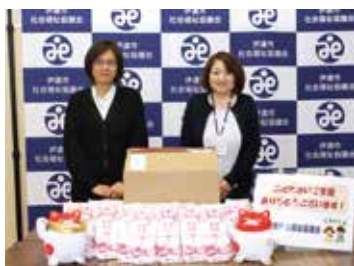
マルハン伊達店 様