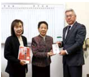
陸奥本流福島こけし会 様