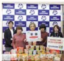
コープふくしま保原店 様