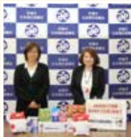
マルハン伊達店 様