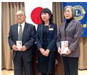
(二財) 福島民報教 育福祉事業団 様 梁川ライオンズクラブ 様