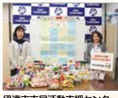
伊達市市民活動支援センター あつまれ「だてな活動」様