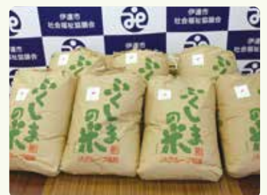
玄米 30kg 7袋