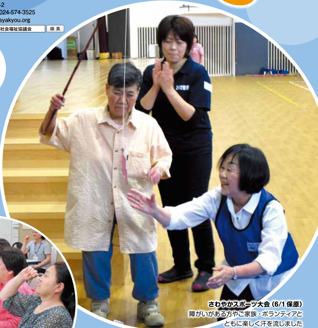
さわやかスポーツ大会 (6/1 保原)