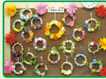
JAすみれ会様による素敵な 手作りリース