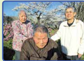
お花見ドライブ 両手に花です!!