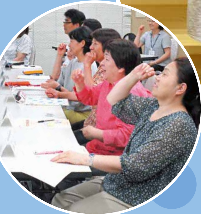
手話奉仕員養成講座 (6/5 ~)