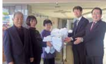
梁川町寿クラブ連合会 様