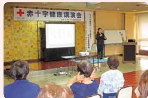
令和元年度 保原町赤十字健康講演会