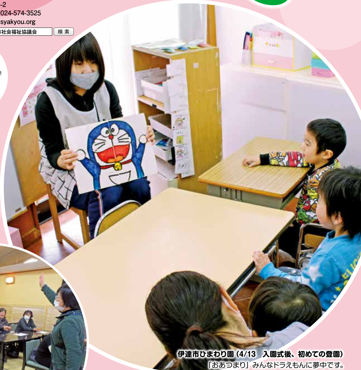
伊達市ひまわり園 (4/13 入園式後、初めての登園)