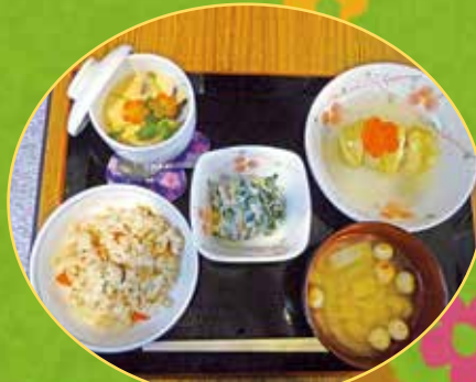
食事ボランティアさんの 手作り昼食