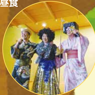
敬老会の職員余興