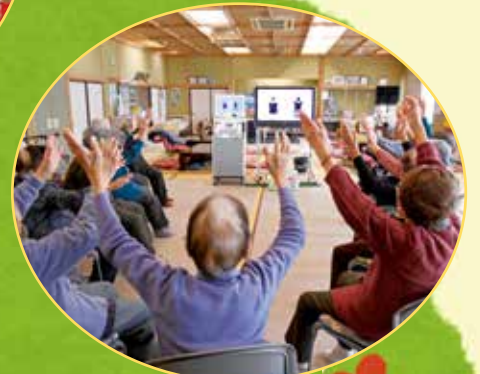
午後のレクリエーション