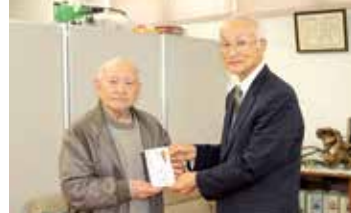
大田小 昭和19年度卒業 羊申同級会一同 様