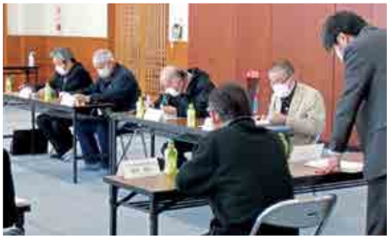
(2月25日梁川寿健康センターにて開催)

今年度は新型コロナウイルスの感染拡大防止により、例年のような参集型の事業実施が困難な状況でしたが、各地区社協では高齢者宅への見守り訪問事業に転換して実施した地区もありました。今後は地区社協のような小地域活動の推進を更に実施してまいりたいと思います。