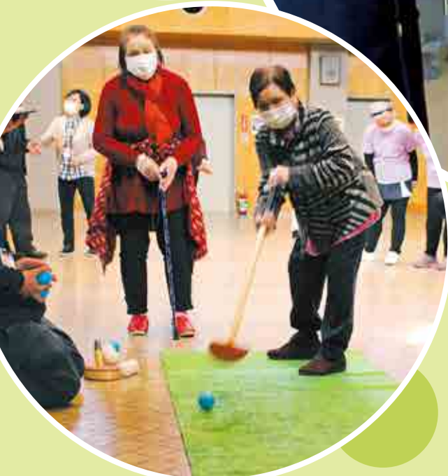
最終回となった復興支援サロン“げんきが〜い” (3/18 保原市民センター)