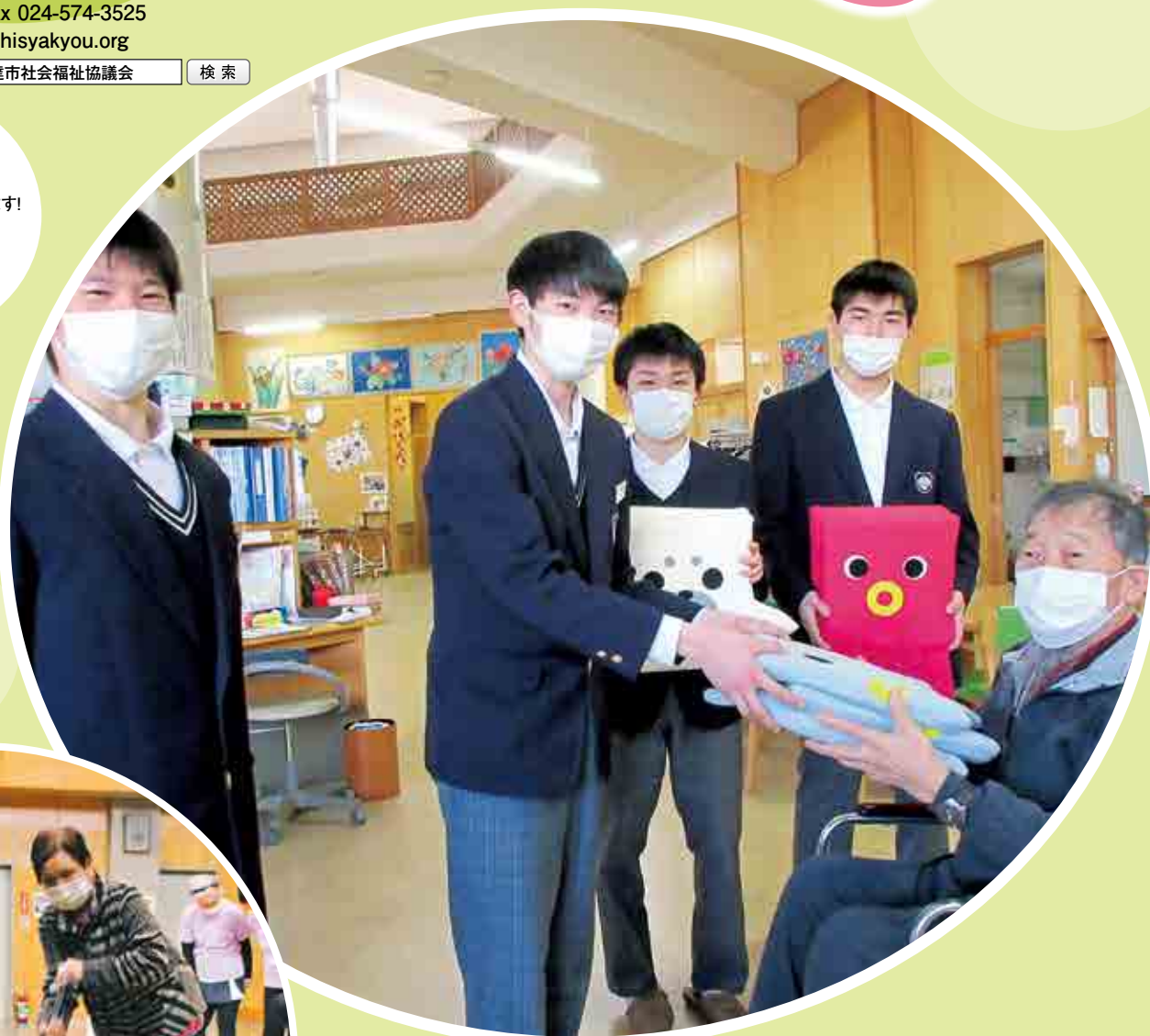
月舘学園中学3年生の皆さんより 手作りクッションをいただきました! (3/11 月舘デイサービスセンター)