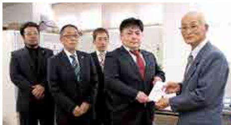
梁川ライオンズクラブ 様