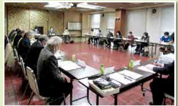
(3月20日保原中央交流館にて開催)