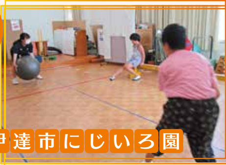
伊達市にじいろ園