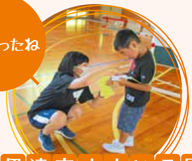
伊達市すまいる園