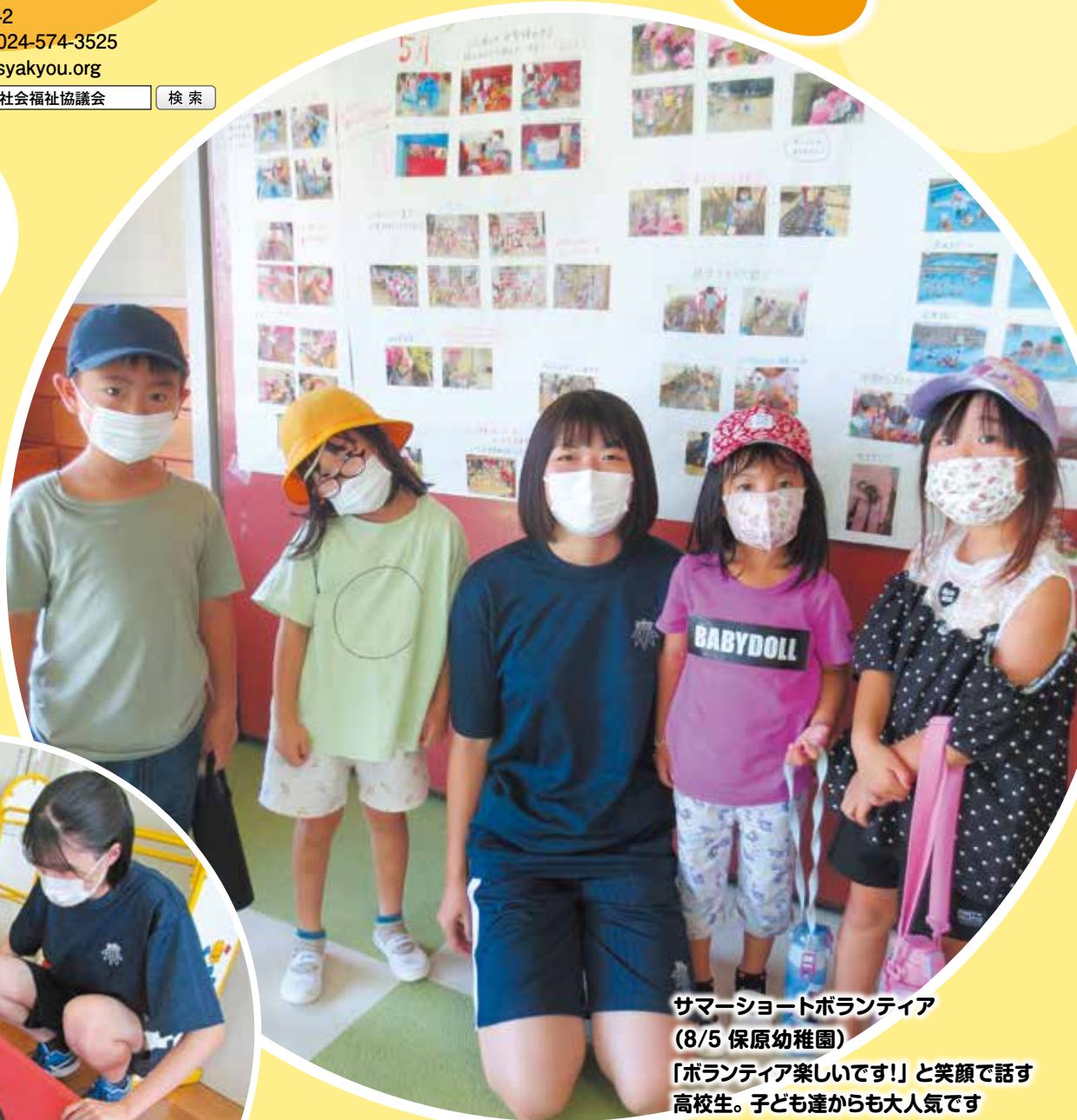
サマーショートボランティア (8/5 保原幼稚園)