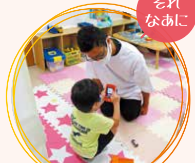
伊達市ひまわり園