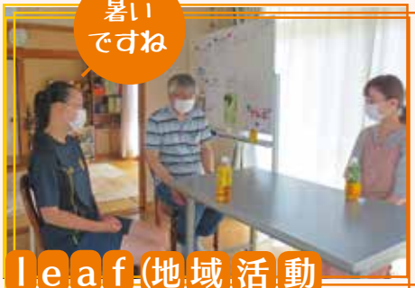
leaf(地域活動 支援センター)