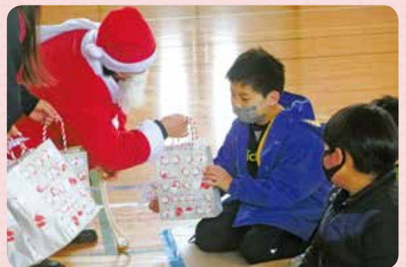
体育館でのクリスマス会 サンタさんにプレゼントをもらいました