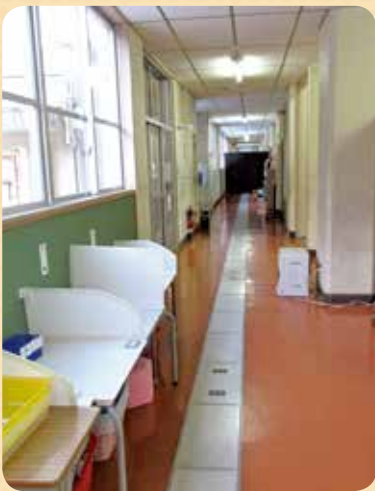
広い廊下 中央の色違いの一本道が 線路のようです