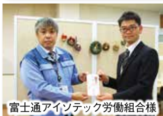
富士通インテック労働組合様