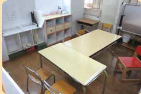
1・2クラスともお集りしたり、お勉強したりする部屋が広くなったよ