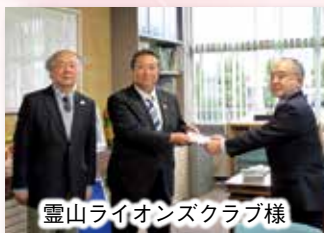
霊山ライオンズクラブ様