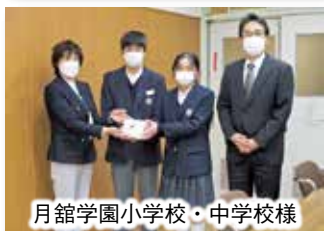
月館学園小学校・中学校様