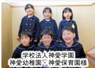
学校法人神愛学園 神愛幼稚園・神愛保育園様