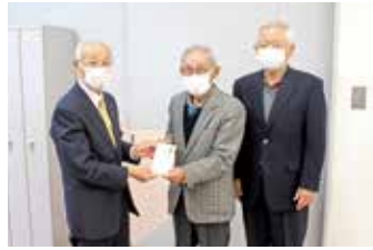
伊達グラウンド・ゴルフ愛好会 様