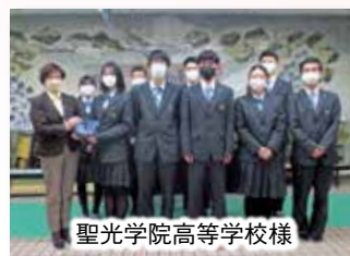
聖光学院高等学校様