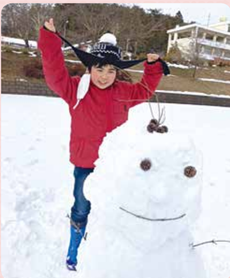
広い校庭で雪ダルマを作りました 雪が降っても子どもたちは 元気いっぱいです