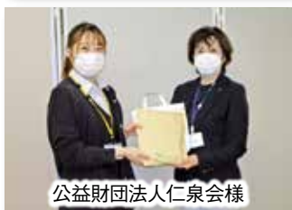
公益財団法人仁泉会様