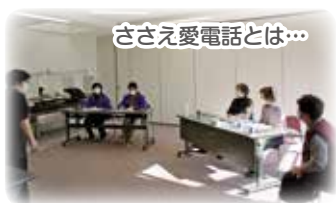
ささえ愛電話とは...