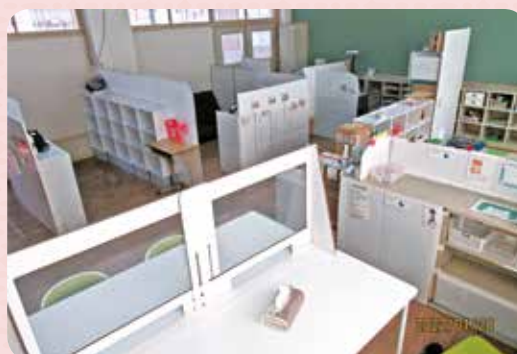
新しい教室に子どもたちはすぐ慣れて、広いスペースを利用して過ごしています