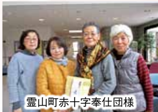
霊山町赤十字奉仕団様

株式会社信濃屋 医療法人桑名医院 株式会社大晶電設工業 ボランティアだて 福島伊達教会 有限会社梁南衛生社 妙伝寺 株式会社 ODATE 工業 株式会社植留緑化土木伊達支店 有限会社勝栄製作所 株式会社ウエスギ 梁川方部民生児童委員協議会 有限会社志賀青果 梁川保育園