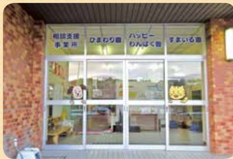
12月1日に開所しました